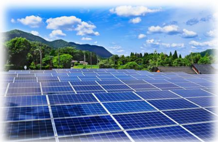
再生可能エネルギーの導入