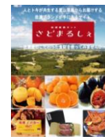
佐渡産直ネット「さとまるしえ」