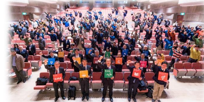
「佐渡未来講座」の様子

産学官金労が相互に連携し、佐渡市を取り巻く社会課題の解決を図るため、「佐渡未来講座」の開催等を通じて、一人ひとりがSDGsを実践。離島佐渡からSDGsの取組を世界に発信します。