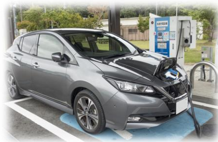
電気自動車の導入