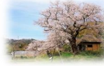
法乗坊のエドヒガン