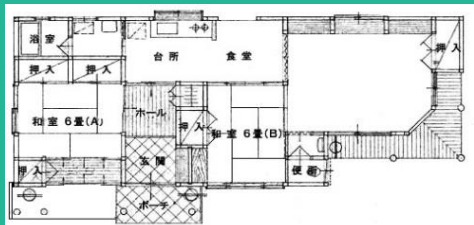
写真・間取りは、はたの住宅B