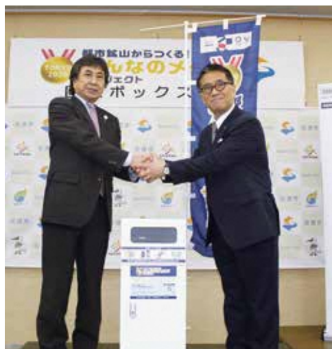
三浦市長に協力要請をする伊藤環境副大臣