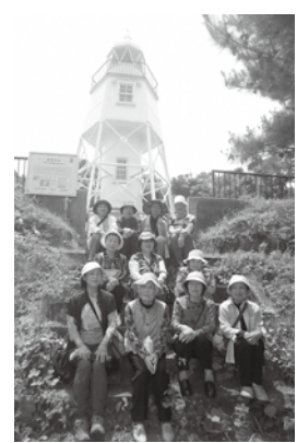
昨年度の春の研修旅行では姫崎灯台に行きました!

期間は、5月の開講式から始まり、春と秋の島内研修旅行や手芸講習会、地区文化祭への出品ことぶき農園での花や野菜作り、お茶会など、盛りだくさんの内容です。さまざまな活動を計画し、その活動を通して楽しみながら学級生同士の交流を広げていきます。 日程など詳しくは、小木地区公民館(☎86-3191)までお問い合わせください。