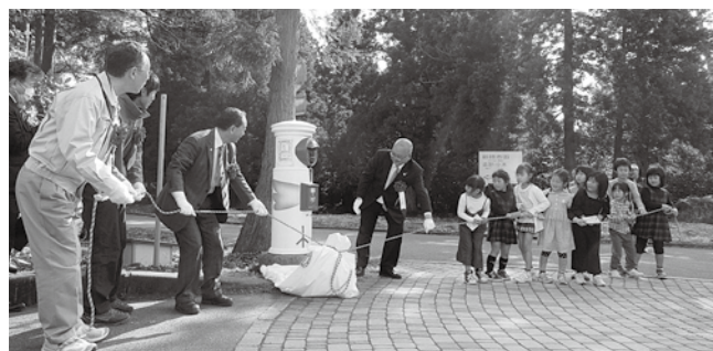
保育園児と一緒にトキポストの除幕式

除幕式の後、サドッキーやトキポストの前で多くの方が記念撮影をする様子が見られました。