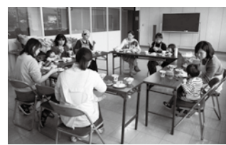
昨年度の様子 みんなで愛情たっぷり料理を食べました♪