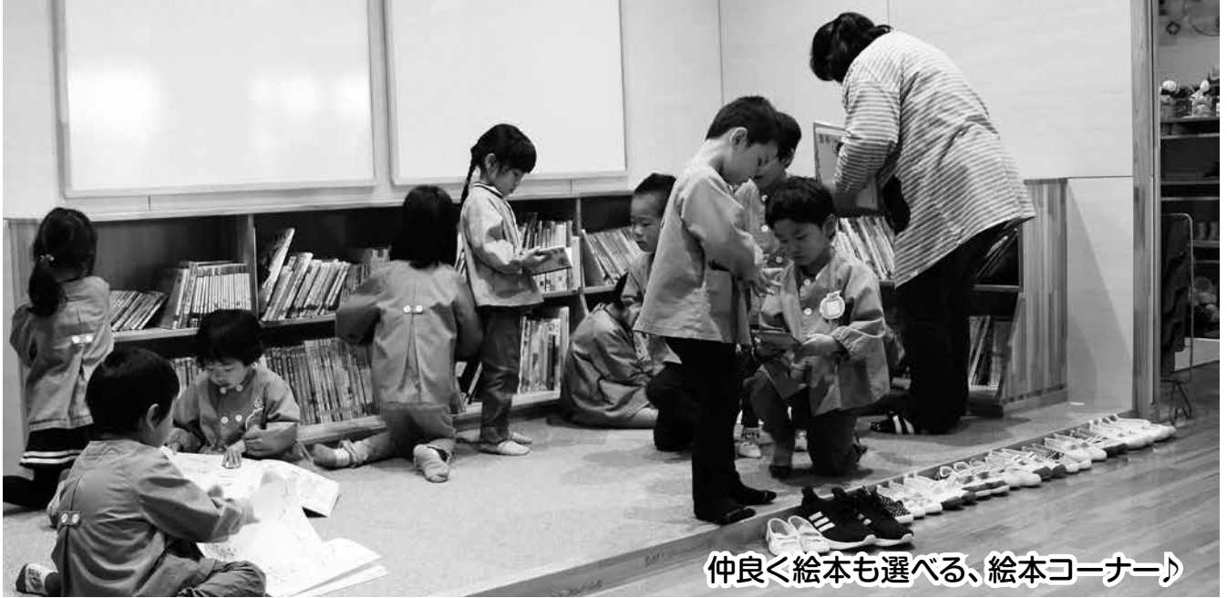
仲良く絵本も選べる、絵本コーナー♪