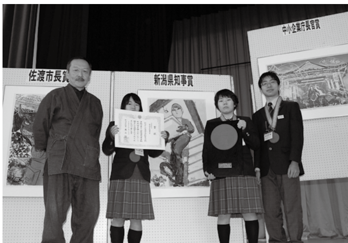
新潟県知事賞を受賞した佐渡中等教育学校の皆さん

全国から予選を勝ち抜いた北は青森県から南は広島県まで、14校が佐渡へ終結し、「佐渡からの便り」をテーマに、取材を通じて佐渡を感じ、その思いを木版に込めました。