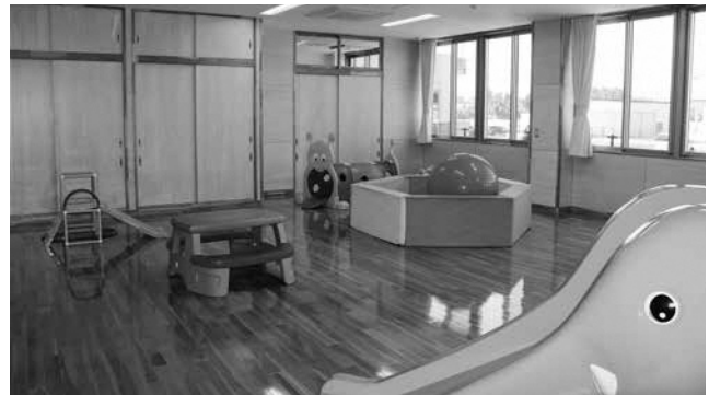
新しく開設した「りょうつ子育て支援センター」