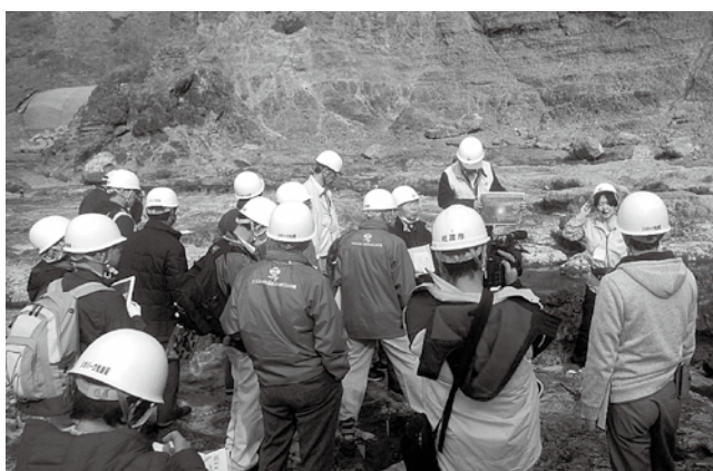
地元ガイドの案内を聞く参加者の皆さん

「救急セットの準備・見直しが必要」、とそれぞれのジオパーク活動が必要に感じる内容を出し合っており共有しました。