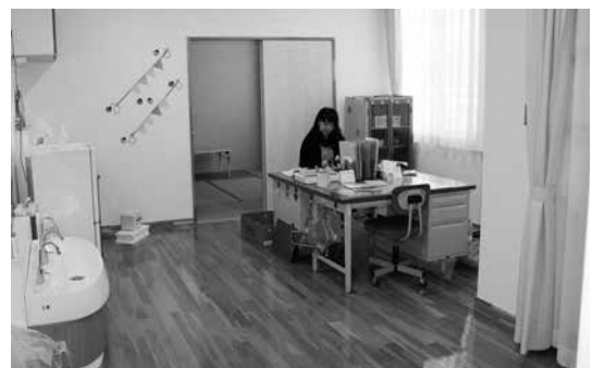
新しく開設した 両津病後児保育室「あさひ」