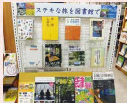
4月の中央図書館のテーマは 「ステキな旅を図書館で」でした♪