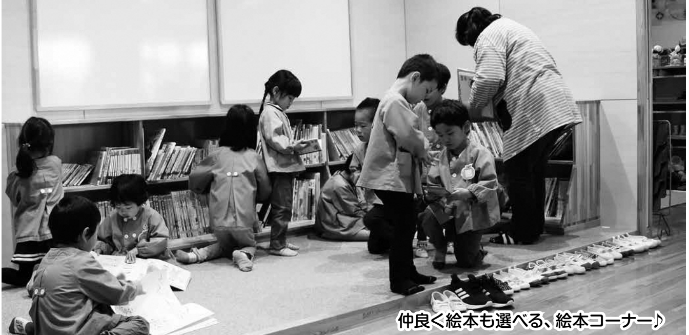
仲良く絵本も選べる、絵本コーナー♪