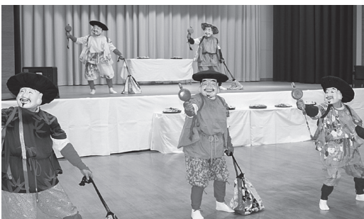
新穂大黒舞愛好会の発表(昨年の様子)

開催時間など詳しくは、新穂地区公民館(☎ 22-2075)までお問い合わせください。