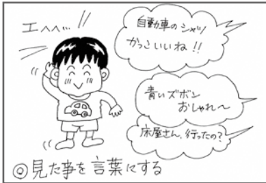
◎見た事を言葉にする