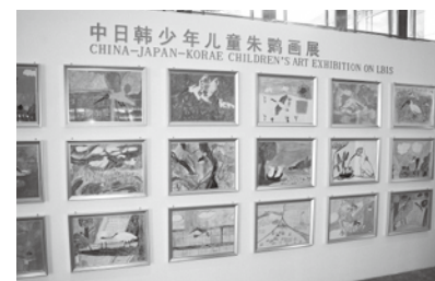
日中韓子どもトキ絵画展

このほか、展示ブースでは3カ国の子どもたちによるトキの絵の展覧が行われ、佐渡の小学生、保育園児の作品も展示されました。