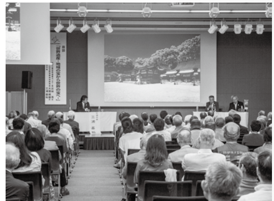
5月に開催した「佐渡は世界の宝島」首都圏イベント