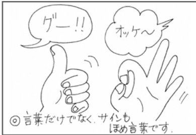
◎言葉だけでなく、サインもほめ言葉です。