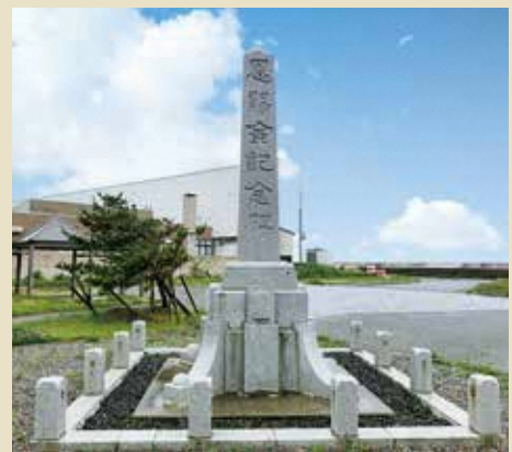
佐渡鉱山が皇室財産から三菱へ払い下げられたことを記念して昭和5年5月に建てられた記念碑