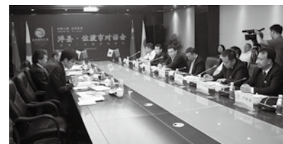
洋県・佐渡市による対話会

また、友好交流を行っている洋県政府の関係者と産業や教育に関する交流と協力について意見交換を行ったほか、日中韓3カ国のトキを保護している自治体との交流会にも参加しました。