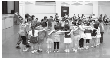
円陣組んでがんばろ〜!

で若さをキープ!」も開催しています。各クラスや自主講座の参加者を募集していますので、興味のある方は金井地区公民館(☎63-4151)までお問い合わせください。