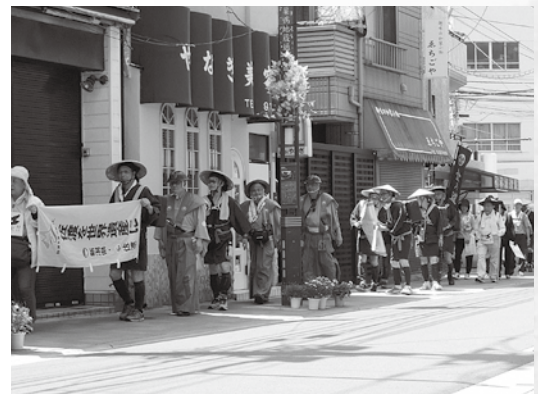
6月に開催した首都圏「金の道ウォーク(板橋～日本橋)」

※このほか、さまざまな団体で世界遺産に関連した多くのイベントやキャンペーンなども展開していく予定です。皆さんもぜひご参加をお願いします。