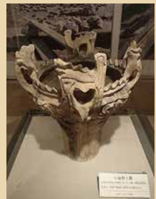
佐渡で出土した火焰型土器 （長者ヶ平遺跡）