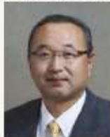
渡辺 竜五 佐渡市長