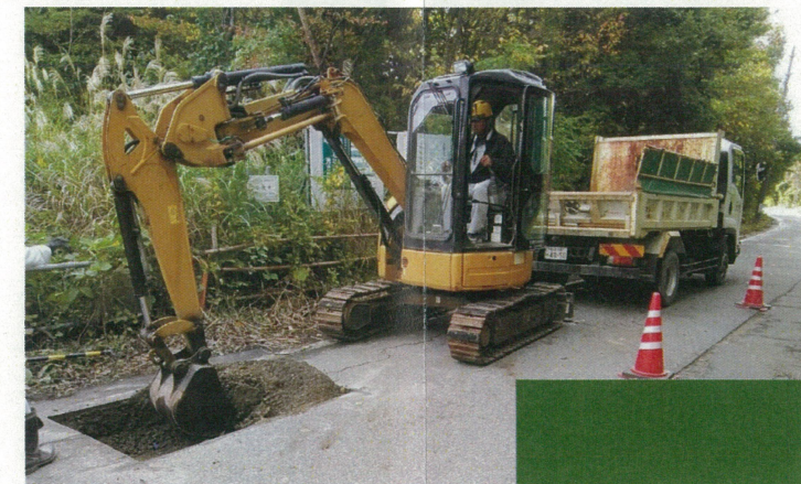
重機による掘削作業