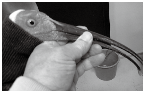
身体計測を受ける「ミライ」