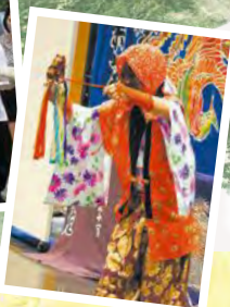
郷土芸能の春駒も登場