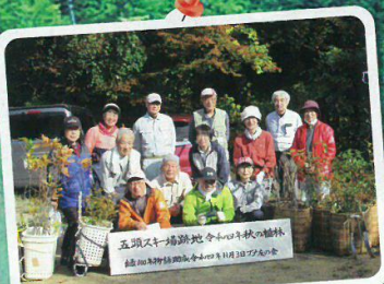
森づくり事業での植樹と育樹活動 (フナ友の会・阿賀野市)