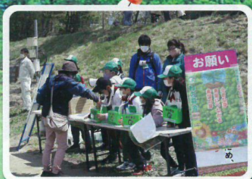
イベントでの「緑の募金」活動を実施 (胎内市緑の少年団・胎内市)

県民の皆様ご協力ありがとうございました。 寄せられた「募金」は、さまざまな緑に変わりました。