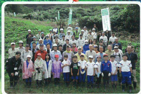
卒寿の森(1人16本の木を植える)活動 (卒寿の森実行委員会・三条市)