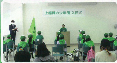
緑の少年団に新たな団員が加入 (上越緑の少年団・上越市)