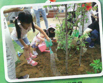
子どもたちの植樹風景 (蔵王のもりこども園・長岡市)