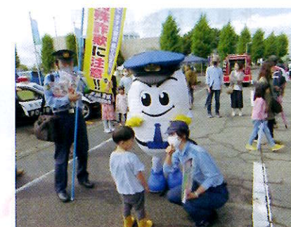
特殊詐欺被害防止広報 (新潟市南区)