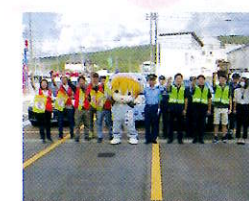
パトロール出発式 (妙高市)