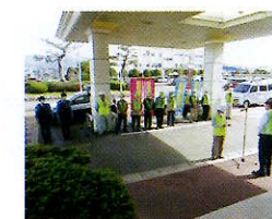
青パト出発式 (阿賀野市)