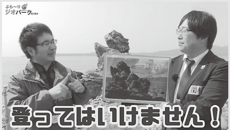
人面岩を背景に説明する職員（人気番組『ぶら〜り ジオパークだっちゃ!』のーコマ

人面岩（正式には立岩）は、はるか昔に溶岩が固まってできました。熱い溶岩が冷えて固まるときに少し縮むため、溶岩でできた岩には多くのひび割れが生じます。そして、波や風雨によって、そのひび割れに沿って削られたため、奇跡的な確率で人の顔の形になりました。現代に生きる我々は、まさに大自然の芸術を目の当たりにしているのです。