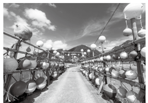
相川地区岩谷口のブイアート

今回は映像配信を主軸に各作家、アーティストが佐渡で作品展示を行う様子や知られざる佐渡の歴史や場所を収録した番組を配信中です。