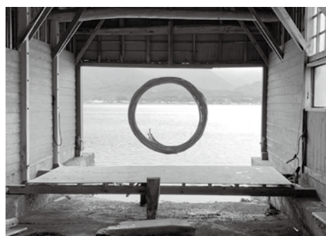
両津地区の加茂湖を望む舟小屋の「円相」

いよいよ始まりました、さどの島銀河芸術祭プロジェクト2020。佐渡の自然や歴史、その中で育まれた民話や伝承、暮らす人々の魅力を島内外からのアーティスト達が作品などを通じ表現していくことを目的に開催しています。