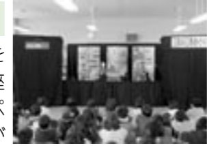
▲クライマックスにかたずをの子どもたち (小木小学校▲▶)

小木図書館では年に1回、人形劇の巡回移動劇場を開催しています。この人形劇は平成3年の公民館講座の婦人教室によって誕生しました。それとともにパペット・シアター・キッチンというボランティアグループが結成され、脚本から人形づくりまでのすべてを手がけ、図書館を拠点に公演活動を展開し、現在に至っています。