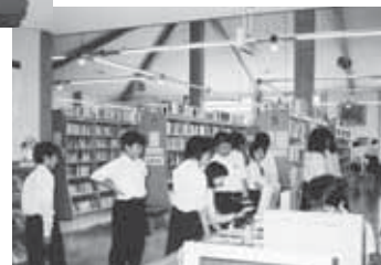
▲総合学習で図書館を利用する中学生