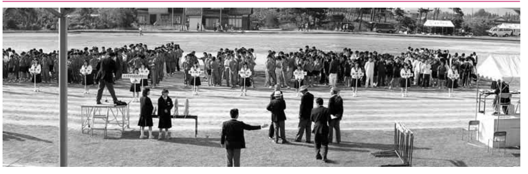
健闘をたたえあう550人余りの生徒たち

この一瞬 大地を蹴って 風となれ 第56回 佐渡市中学校陸上競技大会 2004.6.26 真野陸上競技場