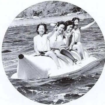
▲マリンバナナボート