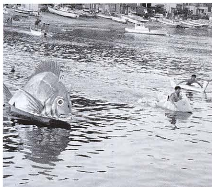
▲ダンボール舟レース