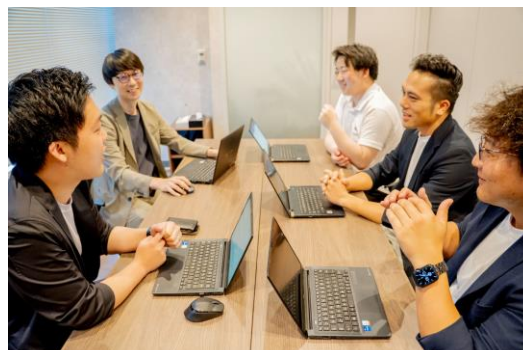
リモート起業相談の情報交換会の様子