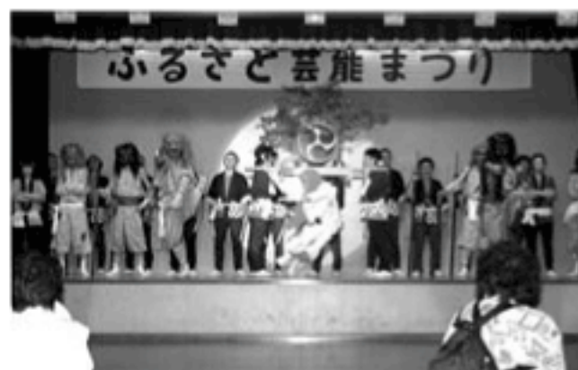
▲鬼太鼓(羽茂高校赤泊分校郷土芸能クラブ)