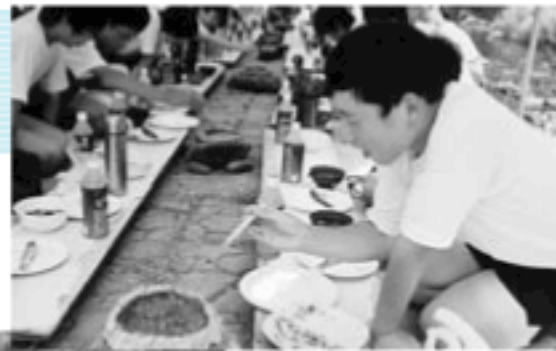
▲鮎の石焼初体験。お味は？