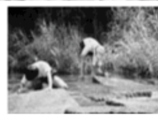
▲鮎発見!!よし獲るぞ!!