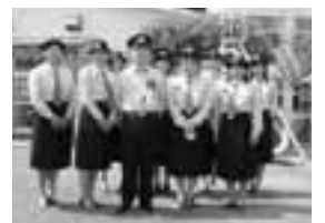
相川消防団「メイビー」11名