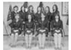
南佐渡消防団「ラスターズ」13名