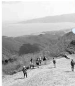
▲大佐渡山脈を望みながら

相川観光協会が主催する「相川ミニ体験ツアー」。今年度の最終回は「大佐渡山脈花の旅～秋編～」。佐渡の大自然を満喫するトレッキングが10月16日に行われました。今回は台風の影響もあり開催が危ぶまれましたが、市内から6人、県内から5人の計11人の参加者があり、ドンデン山荘を出発し金北山から白雲台までの道程で紅葉を見、登るにつれて広がる景色を楽しみました。当日は素晴らしい秋晴れで、金山山頂では厚い霧に覆われましたが、日ごろ味わえない体験に参加者は感じていました。