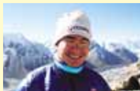
野口健 環境学校 佐渡 校長 野口健 プロフィール

僕は、いわゆる学者的な環境の専門家ではありません。環境や自然については知らないことのほうが多いと思います。そんな僕ですが、僕もみなさんもこの地球と離れられないように「環境」とは無関係ではられないのです。知らないから何もしない、そんな無責任な態度がこの地球を触んできたのかもしれない。僕が自然から教わったことはたくさんあります。きっと参加した生徒のみなにも自然から教わることがあると思います。また、僕が逆に生徒から教わることもたくさんありました。大人たちは間違ったことがあっても目をつぶってしまう。でも子供たちなら間違っていると感じたことを間違っていると言えます。ここで共に学んだ子供らが「環境メッセンジャー」としてがんばってメッセージを伝えていく仲間になってくれることを願います。 一緒にがんばろう！