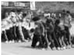
ボール送りリレー

レクリエーション競技主体で各チームとも接戦となり、最後までわからない展開に選手も一段と熱が入ったようです。優勝は徳和チームで昨年に続いての連覇となりました。以下成績は次のとおりです。