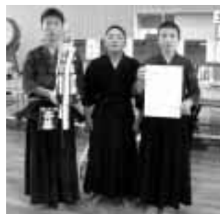
中学生男子団体の部を制した両津少年剣士会Aチーム

一般男子 新穂朱鷺剣友会A 津南剣士会 小木剣士会B 両津剣友会A 一般女子 小木剣友会 新潟佐渡混成 羽茂高校A 両津高校