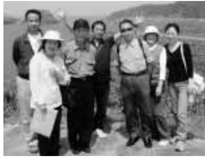
青空教室で大野亀に行ったときの様子