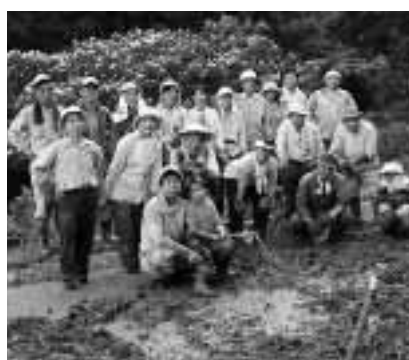
ピオトープづくり

トキの森公園の休館日について ・12月～2月の毎週月曜日 ・12月29日～1月3日の年末年始 3月からは毎日開館の予定です。