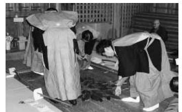
中心より植え始め、放射状に車田方式にゆずの葉を並べている。

いつ頃始まったか明らかではありませんが、「越佐史料」の中に現在大久保で唄われている田遊びの唄が記録に残っていることから、約1259年(頃鎌倉時代)ではないかと言われています。昭和36年には新潟県無形文化財第11号にも指定され、古からの伝承を現在も大切に守り続けています。