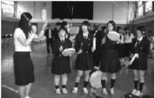
踊り手のための小太鼓・ソゴを習う

夕方からは、赤泊文化会館で小木や羽茂の中小高校生たちの団体(小木おけさ子供連・羽茂民踊子供会)を加えた交流会を行い、その夜は赤泊分校生宅にホームステイしました。