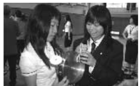
踊りをリードする楽器ケンガリ(雷を意味する)をたたいてみる

28日は、両津「鬼太鼓どっこむ」で共演し、観客の大きな拍手をいただきました。鉦や太鼓 かね をたたきながら、帽子についた長さ2mにもなるリボン リボン を巧みに操り、舞台を踊り回ります。白を基調にした美しい民族衣装で踊る姿は、躍動感にあふれる素晴らしいものです。