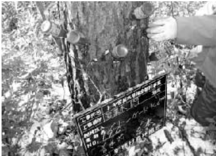
▲選抜されたアカマツの樹幹注入処理作業

このようなトキが営巣木やねぐら木として利用できるアカマツ林を守る取り組みにより、トキが野生にもどつたときに安全に繁殖できるように備えています。