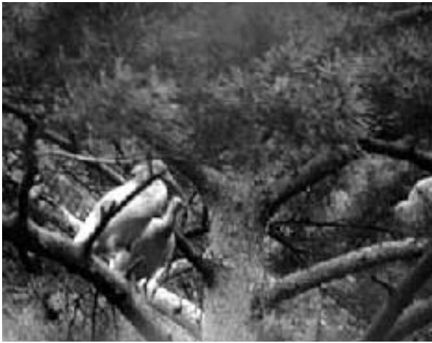
▲アカマツの大木にとまる巣立ちしたばかりのトキ

トキは秋から冬にかけては群れをつくり生活していますが、繁殖期にはいる2月になるとつがいに分かれて行動をするようになり、春から夏にかけて山地の森林にある高木に巣をつくりヒナを育てます。繁殖期の行動圏は、秋冬期に比べて狭くなり、巣を中心に半径2 kmくらいの区域で生活するようになります。