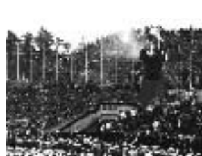
昭和39年新潟国体総合開会式の様子