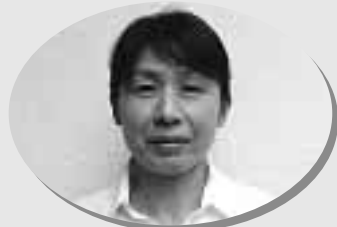
NPO法人 トキどき応援団 事務局長