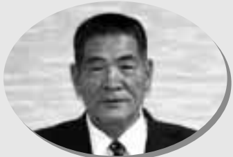
トキの野生復帰 連絡協議会 座長