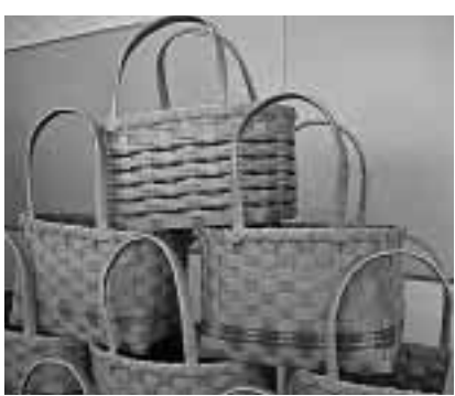
紙紐でできています

2月27日(火)佐渡商工会女性部協議会から、佐渡市に150個のマイバッグを寄贈いただきました。このバッグは再生紙できており、一つひとつ手作りされた、環境にやさしいバッグです。