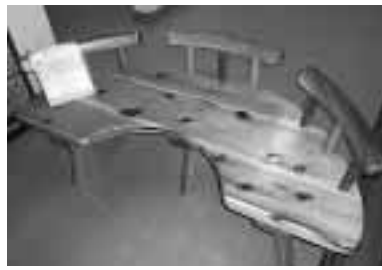
「顔を見ながら話せるベンチ」

島内の木材・竹材利用の促進を目的とし、平成16・17年に実施した木材・竹材利用製品のデザインコンテストにおける優秀デザインを、実際に製品化したものを展示しています。すてきなデザインばかりです。みなさんぜひ見に来てください！