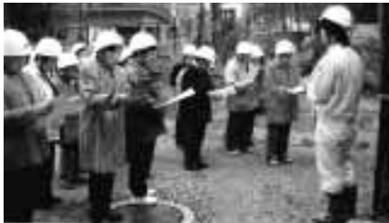
トキ順化施設の見学

等で使用され、捨てられている廃食用油を回収・再利用し、軽油代替燃料(BDF)に精製することでした。メリットとして、捨てられたものを再利用する資源循環型の新燃料に、小児喘息等の原因とされる黒煙は、軽油の1/3以下に減少されるそうです。また、アトピー、酸性雨等の原因と言われる硫酸酸化物は排気ガス中に含まれないなどよい話をビデオを通して説明を受けました。私たちが使っているエネルギー資源のほとんどは石油などの化石燃料で、将来枯渇すると言われており、大量消費は一酸化炭素の増加につながり地球温暖化の原因とされています。