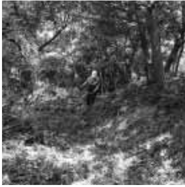
作業風景 遺跡は樹木に覆われているため、藪や竹を刈り払って作業を進めます。

佐渡市教育委員会では、佐渡金銀山遺跡調査事業の一環として、平成17～18年度、佐渡金山遺跡・上相川地区の調査を行ってきました。佐渡金山遺跡は、佐渡奉行所跡・道遊の割戸などの金銀を採掘した場所、鉱山集