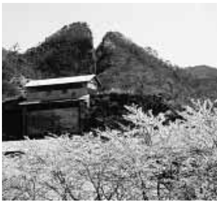
「春の道遊の割戸」

これは、(財)古都保存財団(東京都)が、歴史的な建造物や庭園、町並み、街道、掘割りや水路、古墳、遺跡、城址、社寺仏閣、社叢林、棚田、里山、ため池、湧水等の歴史的・文化的資産が、その周りの山丘や樹林地、水辺等の自然環境と一体となって美しい「歴史的風土」を形成している地域として全国から推薦されたもののなかから選定するものです。「道遊の割戸」は、400年の歴史とともに地域が文化財やその環境を守っていることで評価されました。なお、全国の「100選」につきましては、下記までお問い合わせください。