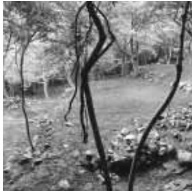
弥左衛門(やざえもん)町に残るテラスと石垣 斜面を削つて平坦にし、そこに家を建てて住んでいたと考えられます。

これまでの調査によって、上相川地区は、江戸時代の平坦面や道路跡、水路跡などの遺構が、地上で確認できるほど数多く残されていることがわかつており、こうした保存状態のよい遺構が広い範囲にわたつて構築され、計画的に町並みが形成された鉱山集落跡は、全国的にみても類例