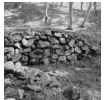
弥左衛門町に残る石垣 壊れてしまった石臼を再利用している石垣で、山中にある上相川にはこうした石垣が多く残っています。

が少なく、鉱山で働く人々の生活を考えていくうえで、貴重な遺跡であると言えます。また、佐渡金山遺跡の特徴として、絵図や文献などの史料が多く残っていることが挙げられ、これらの史料と現在の地形図とを整合した結果、江戸時代の道路が現在も残されていることがわかりました。こうした作業を進めていくことで、江戸時代当時の町割りを正確に復元できる可能性が高いと考えています。 平成17～18年度にかけて行われた調査の範囲は、上相川地区全体における1/5程度であり、同地区の全容を知るまでには至っていませんが、今後、調査によってわかつた平坦面や道跡などの遺構と絵図面との対比や、平坦面の規模の違いによる職業別・身分別の格差の有無など、詳細な検討を実施し、明確にしていきたいと考えています。