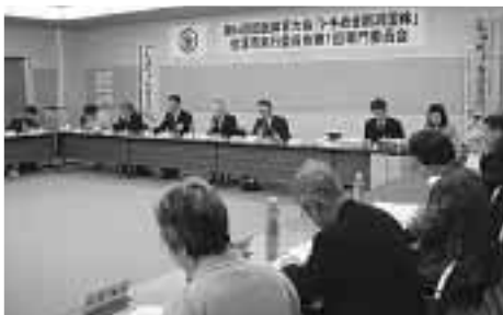
総務企画専門委員会(2/21)

総務企画、競技式典、宿泊衛生、輸送警備の各専門委員会を2月19日～22日に金井コミュニティセンター会議室、本庁大会議室で開催しました。国体開催まで950日(2月19日現在)を過ぎ、各専門委員会では、前年のリハーサル大会と本大会の開催に向け、推進体制の強化、花いっぱい運動の展開、広報啓発活動等、事業の推進のための各基本計画に基づく各要項について、慎重審議していただきました。