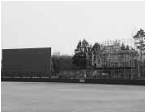
工事中のつつじヶ丘公園佐和田球場

では、バックスクリーンが新装され、今まで以上に投球が見やすくなり、打撃戦による、白熱した試合を繰り広げられるでしょう。平成19年度においても中央競技団体から指摘を受けている箇所について、継続して改修工事を行います。