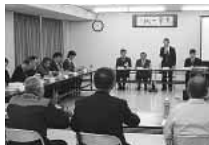
宿泊衛生専門委員会(2/19)