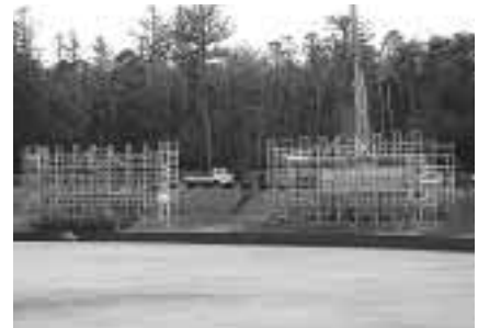
工事中のサン・スポーツランド畑野野球場