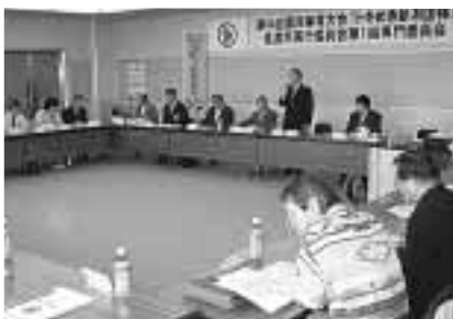
競技式典専門委員会(2/22)