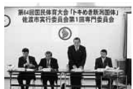
輸送警備専門委員会(2/20)