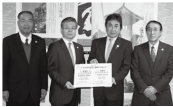
佐渡汽船運輸株式会社様からの贈呈