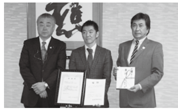
株式会社イトーヨーカ堂様からの贈呈

トーヨーカ堂様からは、平成20年の朱鷺と暮らす郷米の販売当初からコンセプトに共感いただき、販売量1kgあたり1円を寄付頂いています。