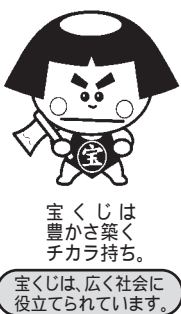
宝くじは、楽しく豊かさ築くチカラ持ち。