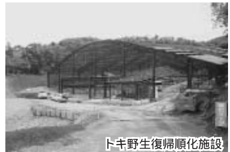
トキ野生復帰順化施設