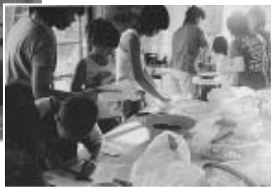
(親子ふれあいの会の様子)

センターの備品として、(テレビ等の家電機器、ステージ、放送機器・座卓、調理テーブル等)を購入しました。組合では、備品を活用し更なる地域の活性化を推進します。