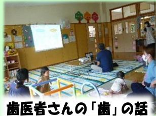
歯医者さんの「歯」の話