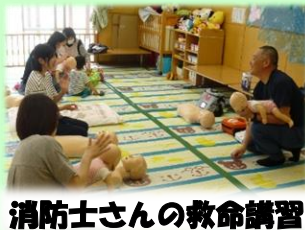
消防士さんの救命講習