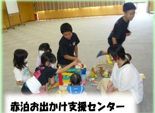
赤泊お出かけ支援センター