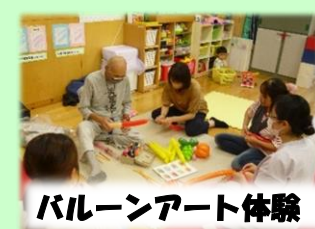
バルーンアート体験