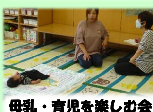
母乳・育児を楽しむ会