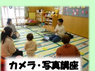
カメラ・写真講座