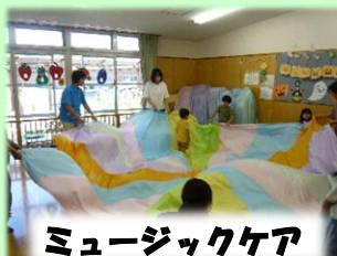
ミュージックケア