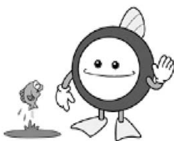
下水道マスコット「スイスイ」