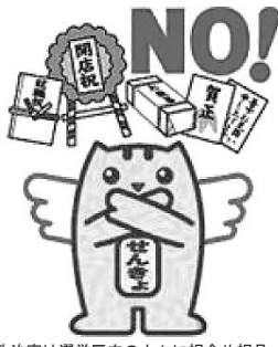
政治家は選挙区内の人々に祝金や祝品、あいさつ状などを出すことは禁止されています