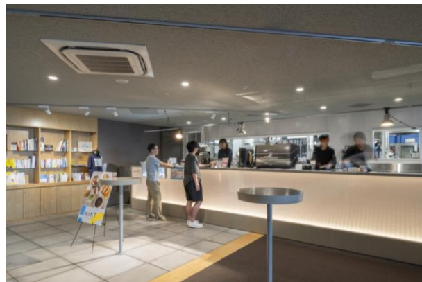
飲食ブースの様子