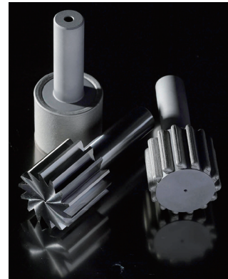
フライスカッター