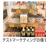
テストマーケティングの様子

有望市場(欧州、オーストラリア)でのテストマーケティング等により、販路拡大や市場への定着を支援します。