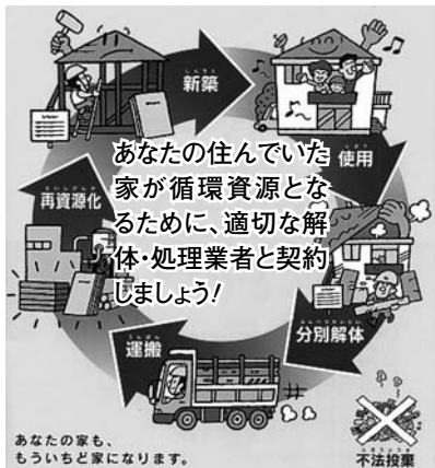
北陸地方建設副産物対策連絡協議会

北陸地方建設副産物対策連絡協議会事務局(北陸地方整備局企画部技術管理課教習係) ☎025-280-8880 ホームページ http://www.hrr.mlit.go.jp/gijyutu/fukusanbutu/