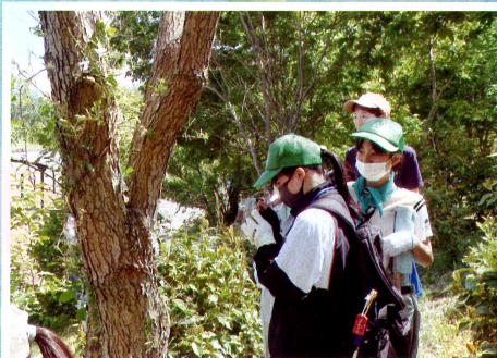
森づくり事業にて樹木プレートの設置 (特色のある緑の公園を造る会・村上市)