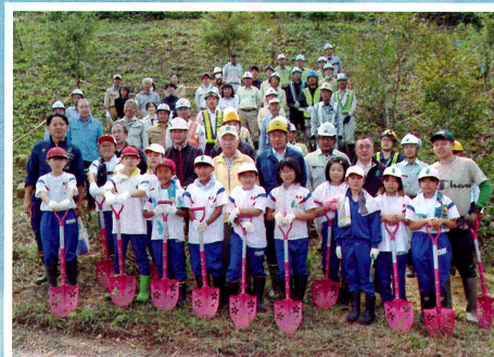
卒寿の森 (1人16本の木を植える) 活動 (卒寿の森実行委員会・三条市)