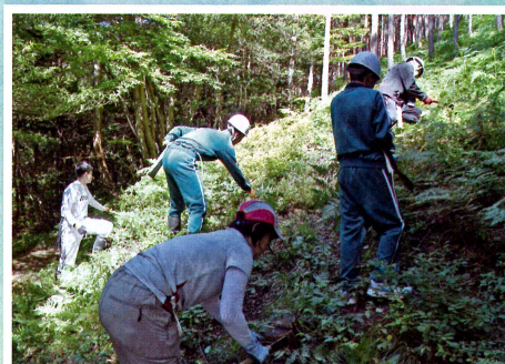
森づくり事業にて学校林の下刈り作業 (佐渡市立松ヶ崎中学校・佐渡市)