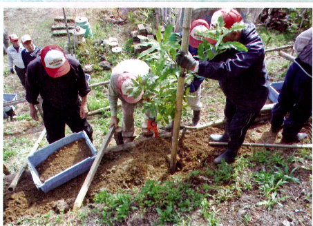
記念植樹事業での植樹風景 (NPO法人関原里山・めかやま会・長岡市)