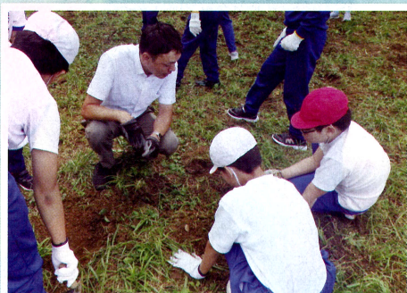
桜の保全活動 (糸魚川地区緑の少年団交流集会・糸魚川市)