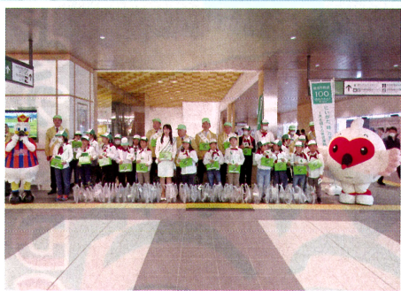
新潟駅で街頭募金を実施 (公社)にいがた緑の百年物語緑化推進委員会・新潟市

県民の皆様、ご協力ありがとうございました。 寄せられた「募金」は、さまざまな緑に変わりました。