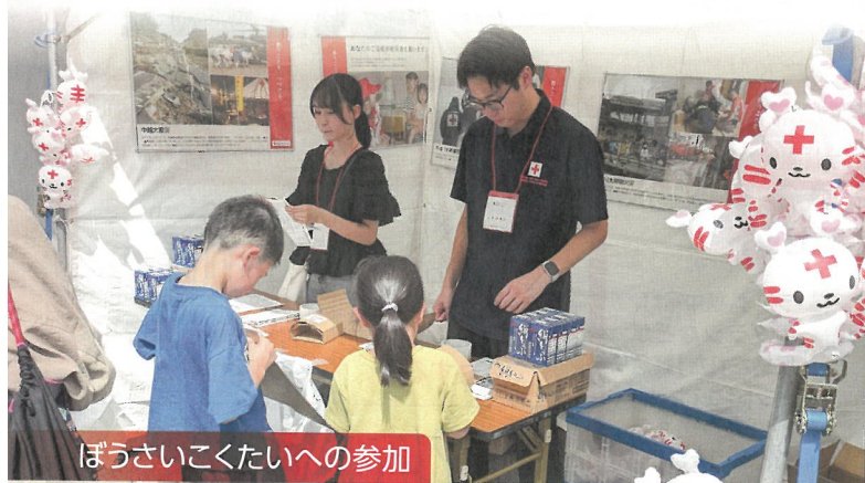
ぼうさいこくたいへの参加