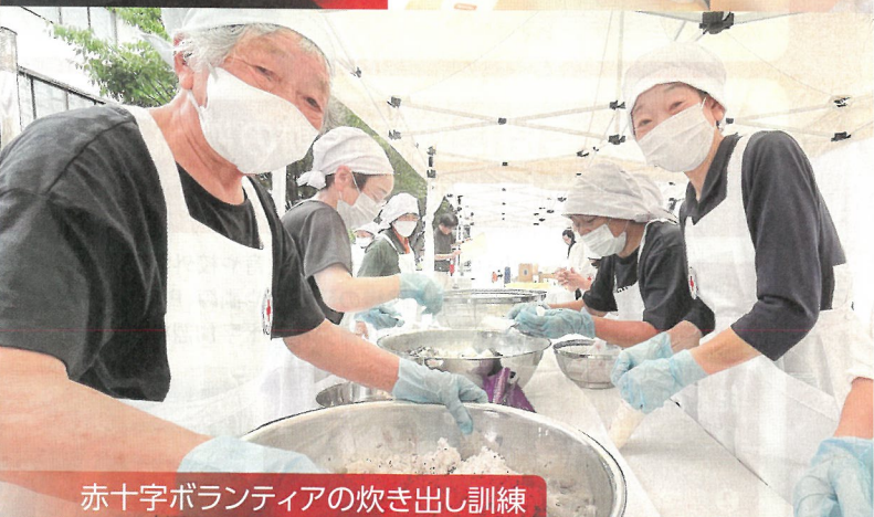
赤十字ボランティアの炊き出し訓練