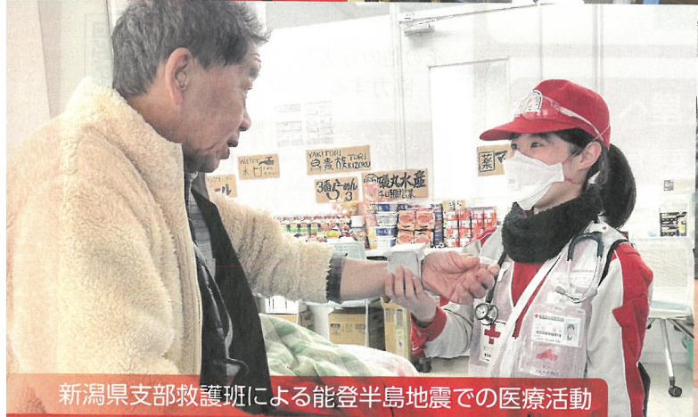
新潟県支部救護班による能登半島地震での医療活動