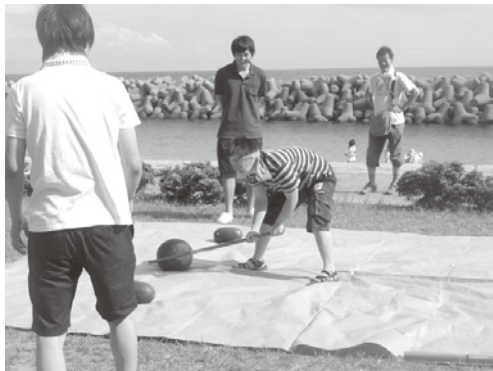
みんな楽しみのワークキャンプ 一番盛り上がるスイカ割り