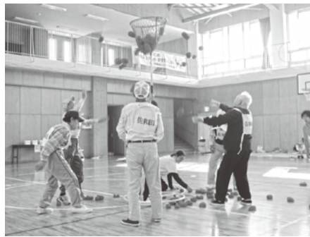
身体障がい者体育大会では選手も応援団も熱く盛り上がります