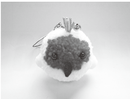
まつはらの家 トキマスコット

4月10日(金)正午～午後1時 施設名 相川岩百合 販売品 手作りパン、クッキー、パウンドケーキ、佐渡島こんぶ、あわびストラップ、笹だんご、乾燥糸こんにゃく、クラフトエコバッグ、クラフトCDラック、土鈴(トキ)、牛乳パックで作った椅子、ぞうきん(3枚組) 4月24日(金)正午～午後1時 施設名 まつはらの家 販売品 裂織製品(コースター、かばん、ペンケースなど)、マスコット製品(トキ)、刺し子ふきん(2枚入り)、人形(福ちゃん、トキ、タヌキ)、トキマグネット、トキハット、マット 市役所社会福祉課障がい福祉係 ☎ 63-51113