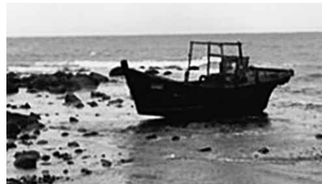
漂着木造船の一例