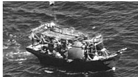
日本海で視認された木造漁船